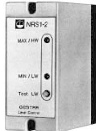
Sygnalizator poziomu MIN/MAX typu NRS 1-2b

Regulator NRS 1-1b pracujący z funkcją regulatora poziomu wody z sygnalizacją stanu minimum.