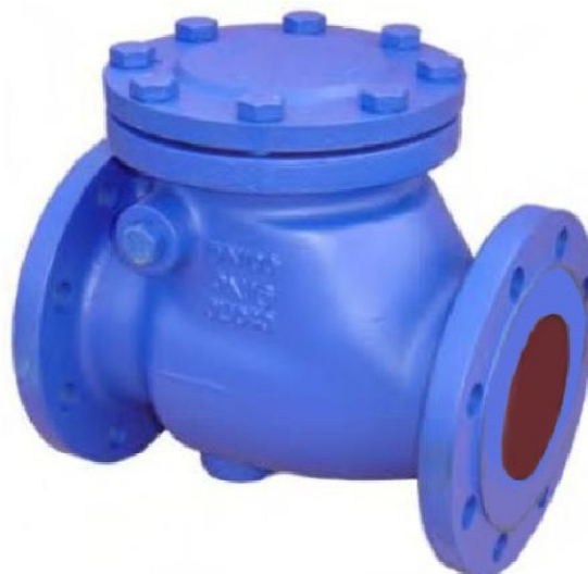
Fot. Kłapa zwrotna z rewizją typ KZR

TEHACO - edycja luty 2007 Producent: zastrzega sobie prawo wprowadzania zmian konstrukcyjnych