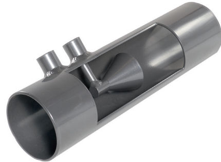
Przepływomierz stożkowy, model FLC-FC