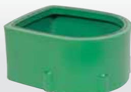
Réhausse (hauteur 300 mm) code : 453018