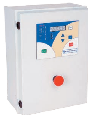
:: Urządzenie zabezpieczająco-sterujące UZS.5