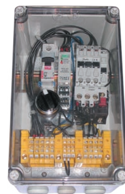
:: Urządzenie zabezpieczająco-sterujące UZS.2