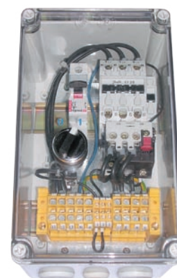
:: Urządzenie zabezpieczająco-sterujące UZS.1