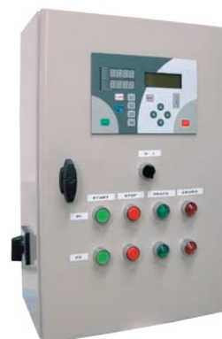
:: Urządzenie zabezpieczająco-sterujące UZS.8