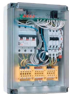
:: Urządzenie zabezpieczająco-sterujące UZS.4