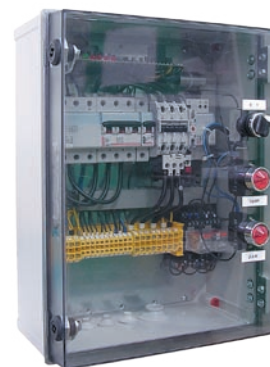
:: Urządzenie zabezpieczająco-sterujące UZS.6