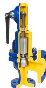
Rysunek 1 Figura 570